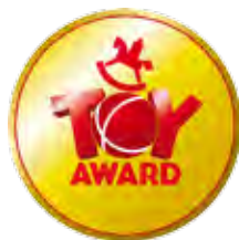
Toy Award 2016 36

39 Wir stellen vor: Das völlig unkomplizierte Abo