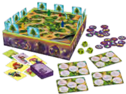
Gigi Gnomo 34