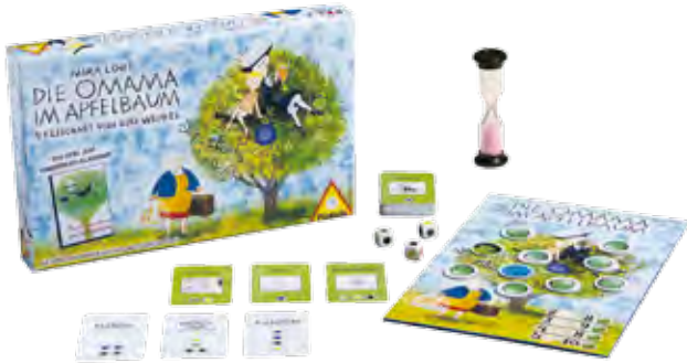
Die Omama im Apfelbaum 10