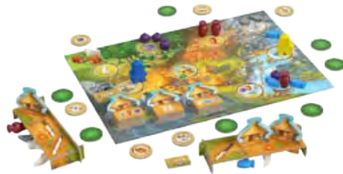
Stone Age Junior 33