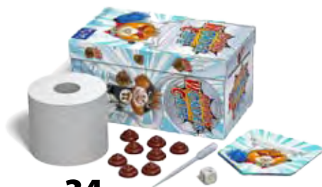
Captain Wondercape 34

frisch gespielt bewertet die mehrfach Test-gespielten, hier vorgestellten Spiele nach folgender Methode: